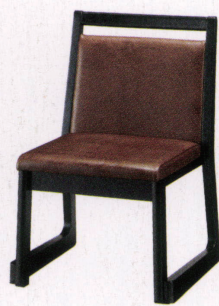
ブラック 張地: レザー・プルアップ・L-8443(C) ¥30,400