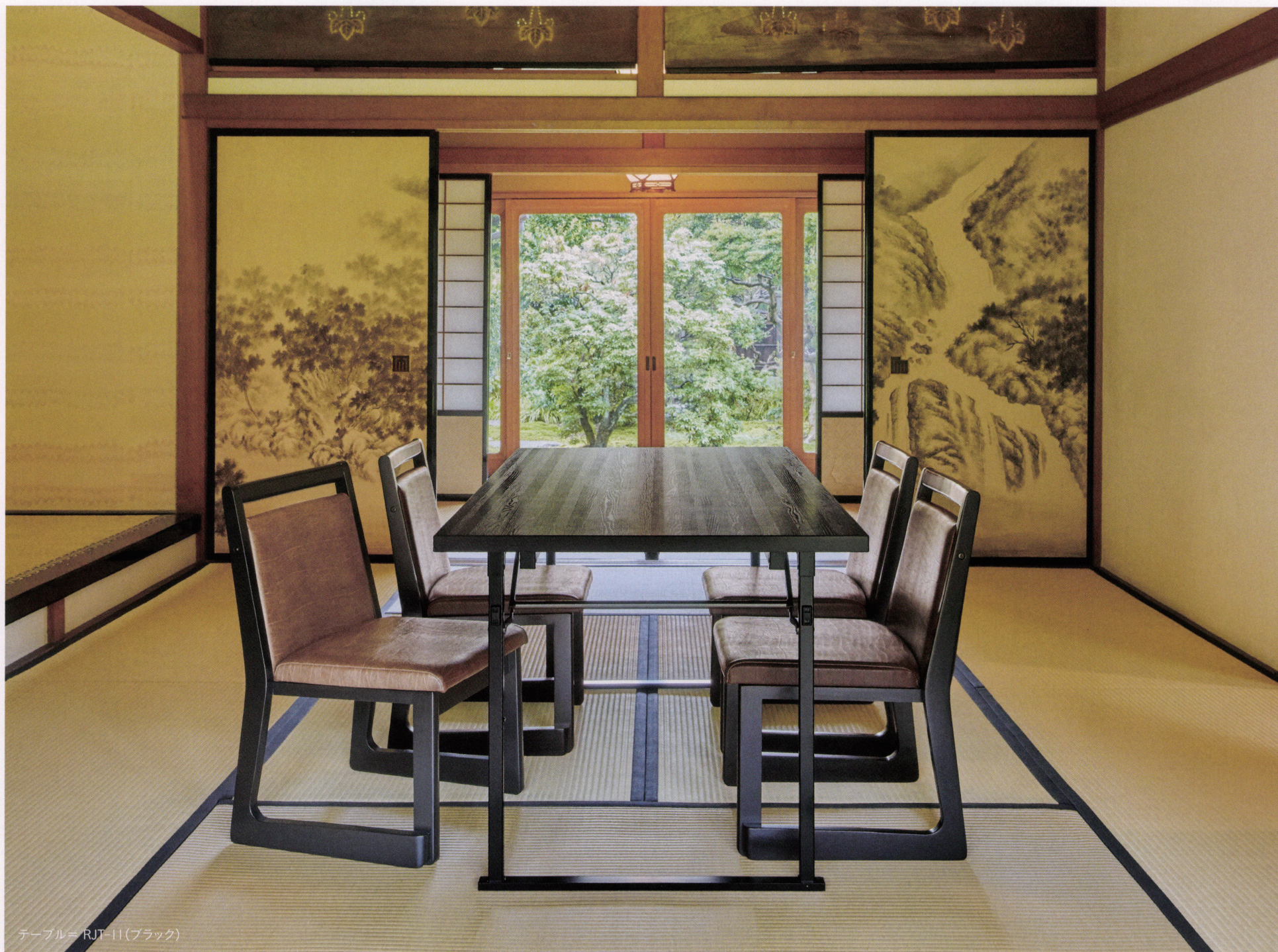
テーブル= RJT-11(ブラック)