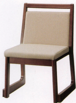
ブラウン 張地: 布・ラポーナ・RB-02(A) ¥28,000