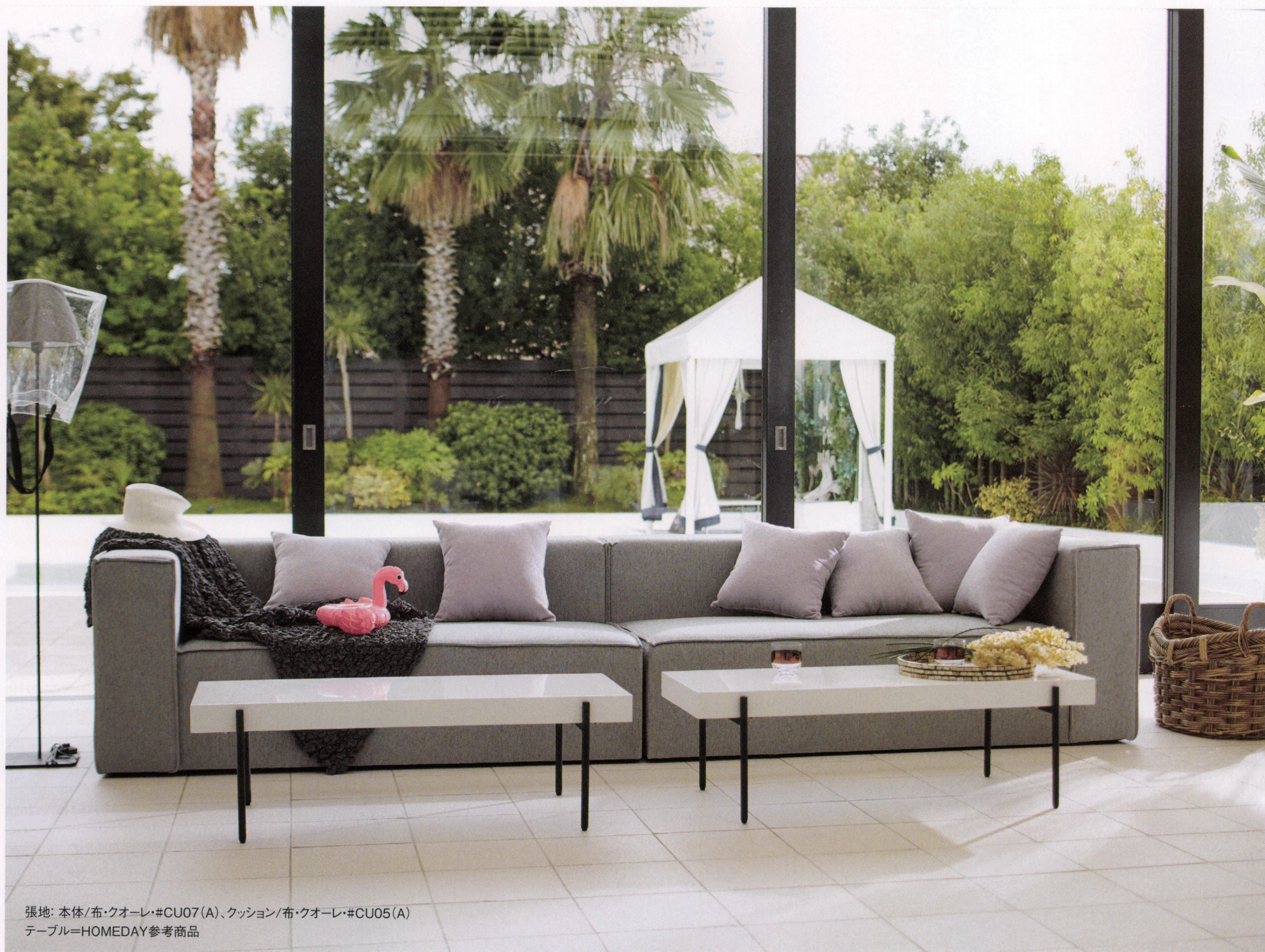
張地: 本体/布・クオーレ・#CU07(A)、クッション/布・クオーレ・#CU05(A) テーブル=HOMEDAY参考商品