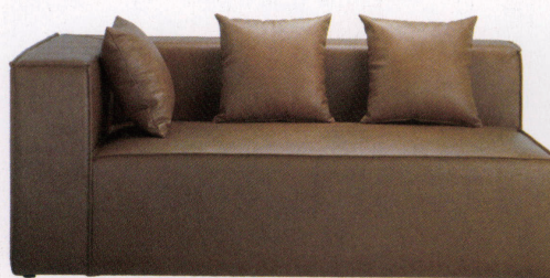
R(右肘用) 張地:レザー・リンカーン・L-8391(B) ¥176,300

*本体とクッションの2色張りににつきましては、別途お見積りとさせていただきます。