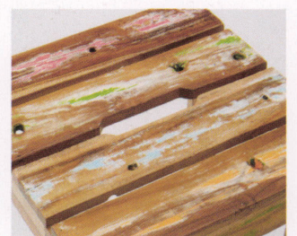
スツールには取手代わりの穴が 座面にあいています。