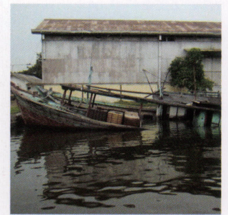
使い古されて廃棄されたボートを 引き取って解体します。