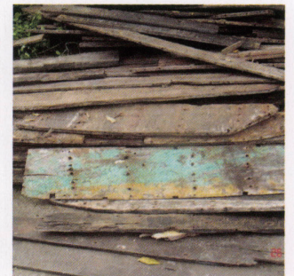
ボートを解体すると材にはダボ穴 やクギ穴が残ります。キズ等のダ メージもあります。