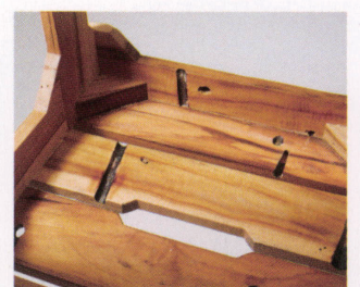
リサイクルボートウッドにはダボ 穴やビス穴、傷等があります。予め ご了承ください。