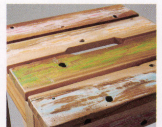
リサイクルボートウッドの表面は敢 えてラフに仕上げられています。マル チカラーはランダムで一定にはな りません。予めご了承ください。