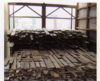
太陽光を利用した炉の中でしっか りと乾燥させてから再利用します。