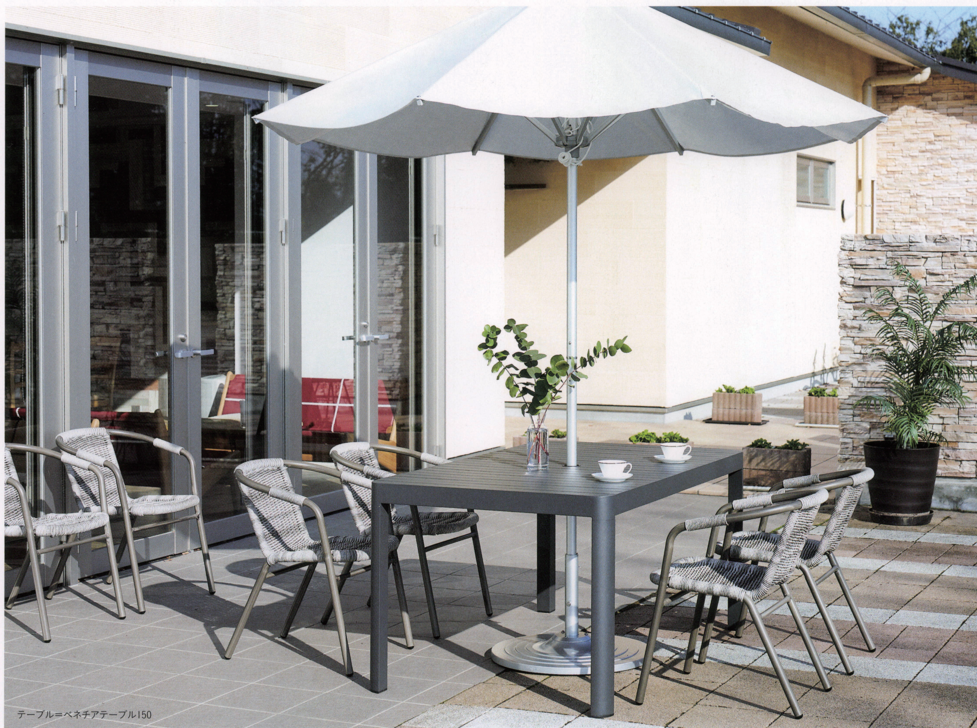
テーブル=ベネチアテーブル150