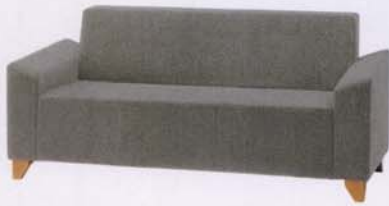
L 張地: 布・クオーレ・#CU07(A) ¥136,000