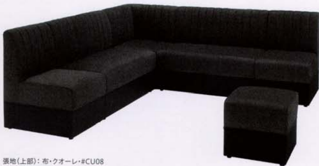
張地(上部): 布・クオーレ・#CU08 (下部・背裏): レザー・オールマイティー・L-1525 (A)ランク

M: ¥38,000 L: ¥66,000 C: ¥70,800 S: ¥21,000