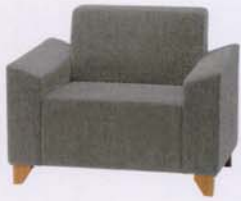
M 張地: 布・クオーレ・#CU07(A) ¥93,000