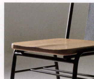
座板は座割り加工されています。