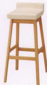
アルダー 張地: レザー・カエサル・No.1(A) ¥28,000