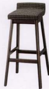
ダークブラウン 張地: 布・ノーチラス・T-4482(D) ¥31,000