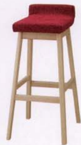
ホワイトウォッシュ 張地: 布・スムージー・UP8281(C) ¥30,000