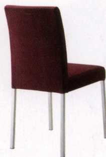
張地: 布・カプリス・7(D) ¥37,800