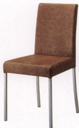
張地: レザー・クロコモード・UP880(B) ¥34,600