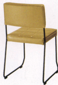
張地：レザー・サンセブン・L-8638(A) ¥39,000