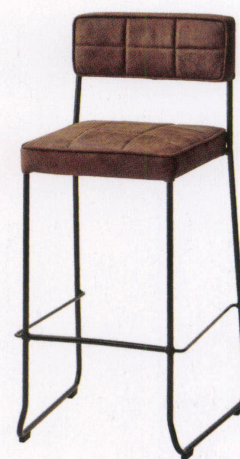
張地：布・エームマスター・マホガニー(D) ¥51,400