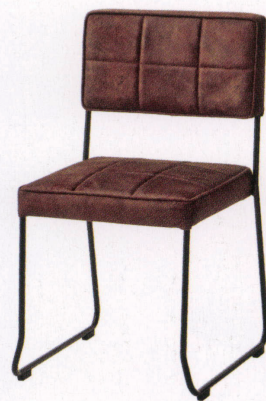
張地：布・エームマスター・マホガニー(D) ¥44,400