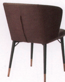
張地：レザー・プルアップ・L-8443(C) ¥60,800