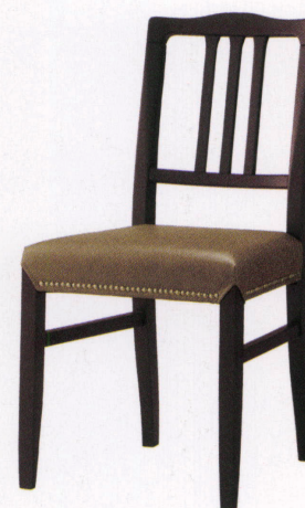
張地: レザー・リンカーン・L-8391 (B) ¥32,200