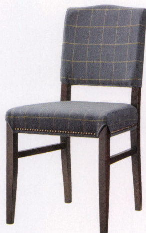
張地: 布・リボン・RB-334 (E) ¥39,200