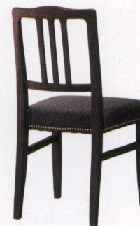
張地: 布・トラッド・TR-2009 (E) ¥35,800