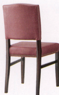
張地: レザー・ブルアップ・L-8442 (C) ¥36,600