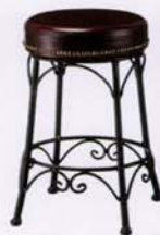
A 張地: レザー・サンセブン・L-1919(A) ¥27,000