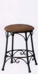
A 張地: 布・クルーズミス・UP8122(E) ¥27,400