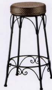
B 張地: レザー・ソフィア・L-1095(C) ¥30,200