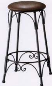
B 張地: レザー・プルアップ・L-1012(D) ¥28,800