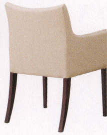
ダークブラウン 張地：レザー・シャバクロ・L-8176(B) ¥61,900