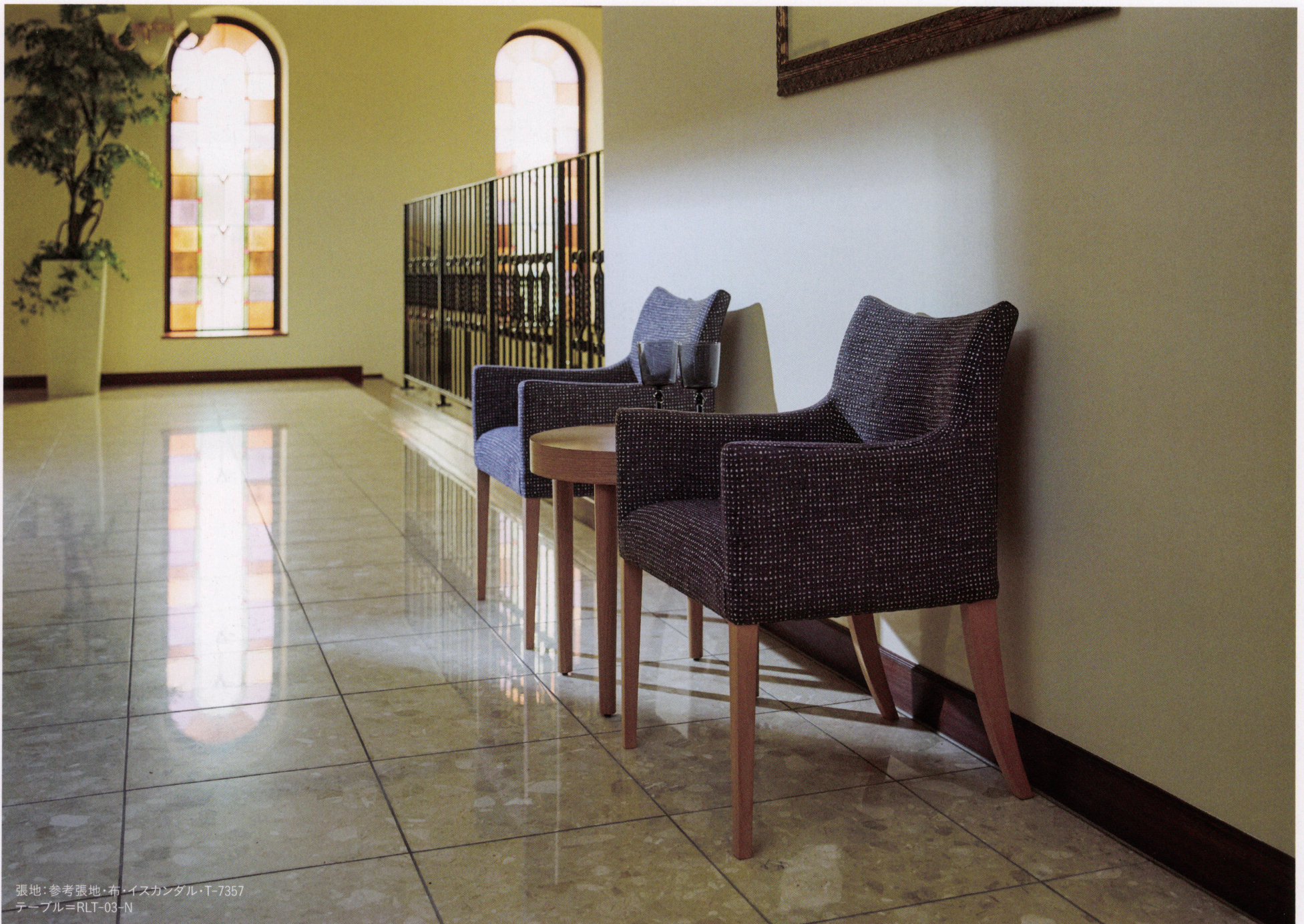
張地：参考張地・布・イスカンドル・T-7357 テーブル=RLT-03-N