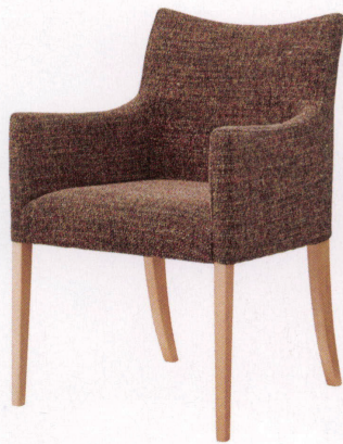
ナチュラル 張地：布・エディ・8(D) ¥67,700