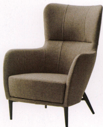
張地: 布・トラッド・TR-2001 (E) ¥144,000