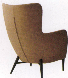
張地: レザー・デニムII・UP870 (B) ¥127,500