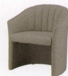
マルセロ ¥72,100~ P 32