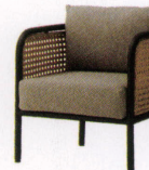
ハミルトン ¥120,000~ NEW P 53