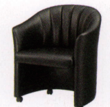
マルセロ2型 ¥73,700~ P 32