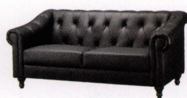
マンハイム ¥125,000 P 50