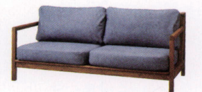
ルイジアナ ¥240,000~ P 42