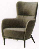
オルシャマ ¥122,000~ NEW P 23