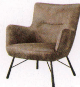
トロンハイム ¥98,000~ P 26