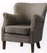
ジェントル ¥103,000~ P 34