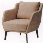
モンリケ ¥125,000~ NEW P 25