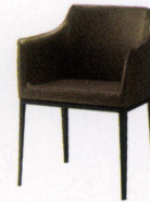
ミランダ ¥62,000~ P 27