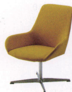
カルパドス ¥68,000~ P 30