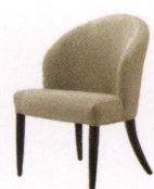
ドルン ¥64,000~ P 39