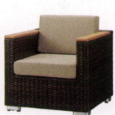
ロードス2型 ¥110,000~ 限定品 P 58