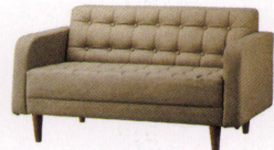
セレスタン 108,000~ 変更有 P 45