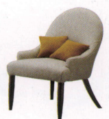
カーディナル ¥74,000~ P 37