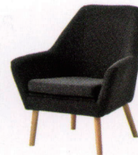
エドモンド ¥79,800~ NEW P 35