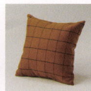
置きクッション ¥9,000~ P 45