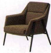
テボリ ¥105,000~ NEW P 24