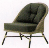
カンプリス ¥98,000~ NEW P 56