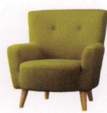
モンベリア ¥94,000~ P 36