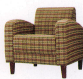
バグー ¥75,000~ P 49