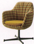
ダラス ¥77,300~ P 29