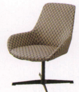
カルパドス-BK ¥68,000~ P 28