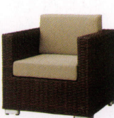
ロードス ¥113,000~ P 58