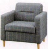
セルドフ ¥102,000~ P 48