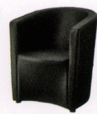
マルジット ¥43,000~ P 33