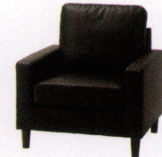
ポワーズ ¥64,000~ P 51