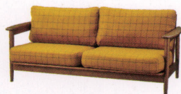
オregon ¥220,000~ P 43