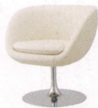
ジェフリー ¥65,000~ P 31