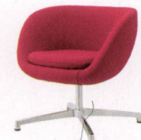
ジェフリー2型 ¥69,600~ P 31