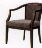
オテル ¥58,000~ 限定品 P 41