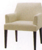
クレメント ¥67,000~ P 38