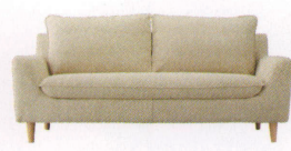
モディ ¥158,000~ P 44