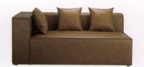
テネシーR/L ¥165,000~ P 47