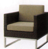
マラガ ¥92,000~ P 57