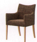
ミハリカ2型 ¥59,000~ P 40