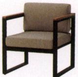
クレモア ¥60,000~ NEW P 54