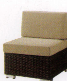
ロードス(肘なし) ¥88,000~ P 59